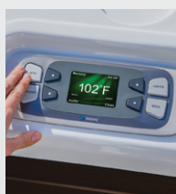
Panneau de commande LCD couleur