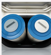
Filtration à action doubleCirculation SilentFlo