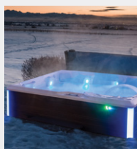
Isolation haute densité FiberCor®