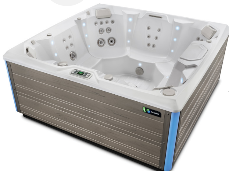
Avec coque Blanc alpin et habillage Gris côtier